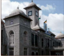
ಕಸ ನಿರ್ವಹಣೆ ಬಳಕೆದಾರರ ಶುಲ್ಕವನ್ನು ವಿದ್ಯುತ್ ಬಿಲ್ ಜೊತೆಗೆ ಸಂಗ್ರಹಿಸುವುದು ಪ್ರಸ್ತಾವನೆ ಹಂತದಲ್ಲಿದೆ. ಸರ್ಕಾರದ ಅನುಮತಿ ಸಿಕ್ಕಿ ಬಳಿಕವಷ್ಟೇ ಇದು ಜಾರಿಯಾಗಲಿದೆ ಎನ್.ಮಂಜುನಾಥ ಪ್ರಸಾದ್ ಆಯುಕ್ತರು, ಬಿಬಿಎಂಪಿ

ಅಂಗೀಕಾರಗೊಂಡ ಬಿಬಿಎಂಪಿಯ ಪೌರ ಕಸ ನಿರ್ವಹಣೆ ಉಪನಿಯಮಗಳ ಕುರಿತು ರಾಜ್ಯಪತ್ರದಲ್ಲಿ 2020 ಜೂನ್ 4ರಂದು ಅಧಿಸೂಚನೆ ಪ್ರಕಟವಾಗಿದೆ. ನಿತ್ಯ 100 ಕೆ.ಜಿಗಿಂತ ಕಡಿಮೆ ಕಸ ಉತ್ಪಾದಿಸುವ ಮನೆಗಳು /ಕಟ್ಟಡ ಸಮುಚ್ಚಯ ಗಳು ಮತ್ತು 100 ಕೆ.ಜಿ ಗಿಂತ ಕಡಿಮೆ ಕಸ ಉತ್ಪಾದಿಸುವ ಹಾಗೂ 5000 ಚದರ ಅಡಿಗಿಂತ ಕಡಿಮೆ ವಿಸ್ತೀರ್ಣದ ವಾಣಿಜ್ಯ ಮತ್ತು ಇತರ ಕಟ್ಟಡಗಳಿಗೆ ಇದರ ನಿಯಮ 15 ಇ ಮತ್ತು ಬೆಡ್ ಎಫ್ ಪ್ರಕಾರ ಬಳಕೆದಾರರ ಶುಲ್ಕ ನಿಗದಿ ಮಾಡಲಾಗಿದೆ. ಅದರ ಪ್ರಕಾರ ಪ್ರತಿ ಮನೆ ಮತ್ತು ವಾಣಿಜ್ಯ ಕಟ್ಟಡಗಳಿಂದ (ದೂಡ್ಡ ಪ್ರಮಾಣದ ತ್ಯಾಜ್ಯ ಉತ್ಪಾದಕರನ್ನು ಹೊರತುಪಡಿಸಿ) ಪ್ರತಿ